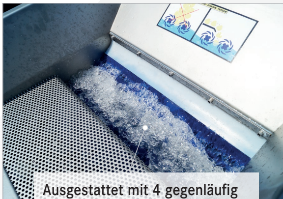
Ausgestattet mit 4 gegenläufig rotierende Bürsten für intensives Waschen