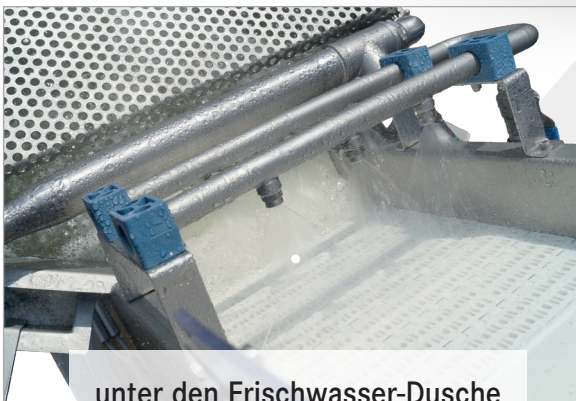
unter den Frischwasser-Dusche weitergeleitet